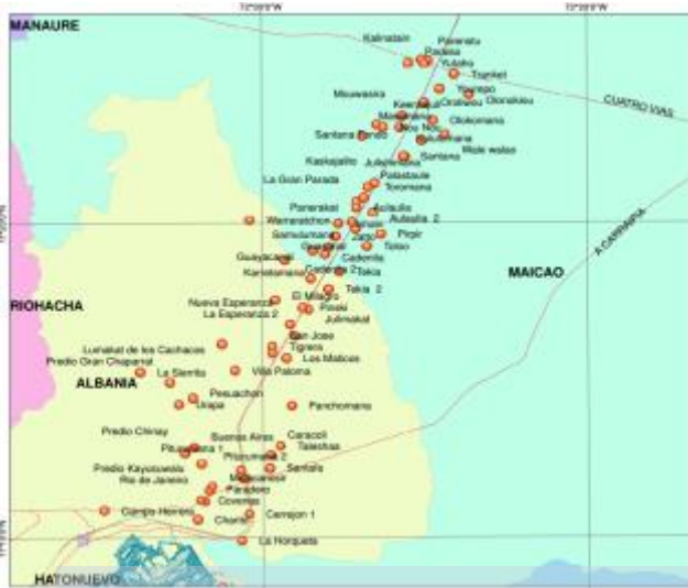
SECTOR I: KM0 AL KM43