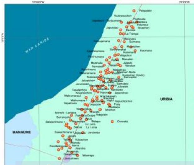
SECTOR III: KM80-KM119