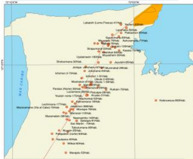
SECTOR IV: KM120 – KM 141