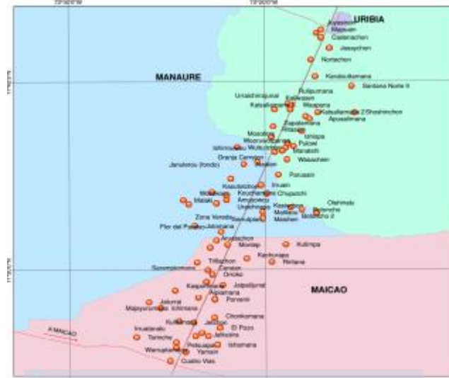
SECTOR II: KM44 AL KM 79